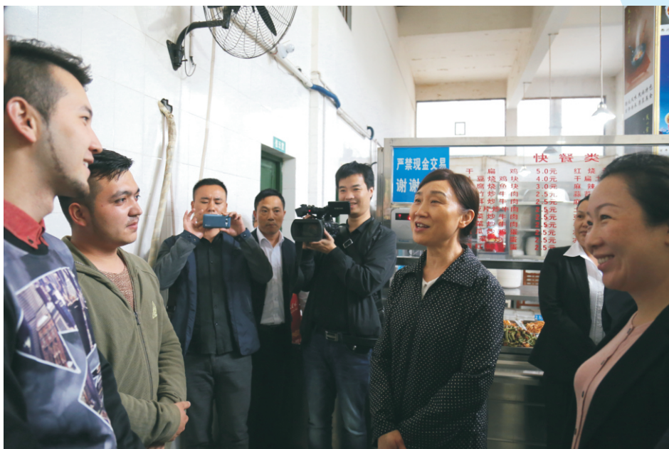
10月28日下午，湖南省委常委、政法委书记李微微一行来我校考察调研。图为李微微与我校少数民族学子亲切交谈。