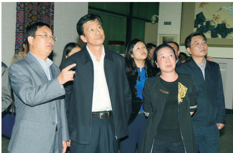
10月27日，省人民政府副省长蔡振红莅临我校调研。图为蔡振红参观我校黄永玉艺术博物馆。