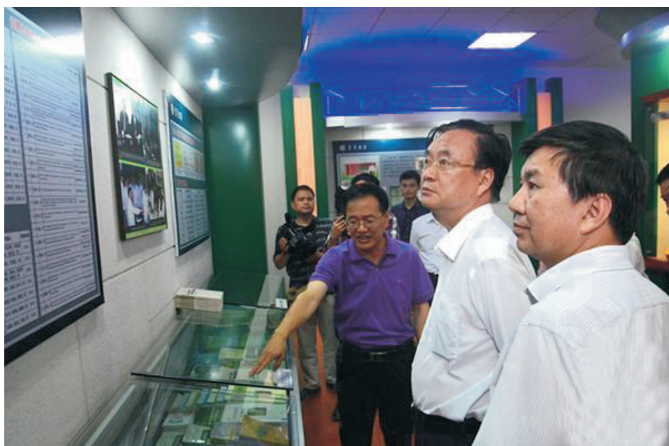
9月29日下午，副省长李友志一行来我校现场办公。