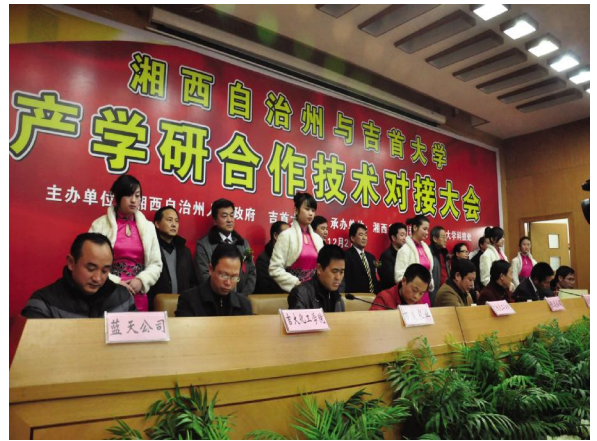
12月27日上午,湘西自治州与吉首大学产学研合作技术对接大会在我校隆重举行。