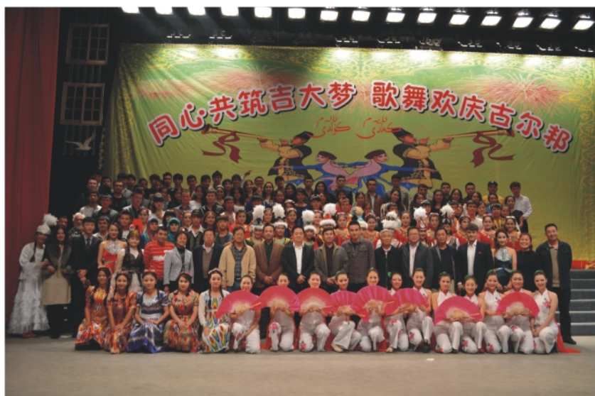
10月16日晚，我校举办“同心共筑吉大梦·歌舞欢庆古尔邦”文艺晚会。