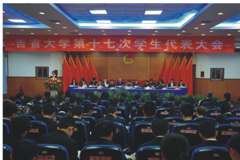
11月17日，我校第17次学生代表大会在砂子坳校区模拟法庭召开。