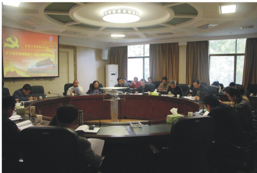
11月21日上午，校党委中心组集中学习党的十八大精神。