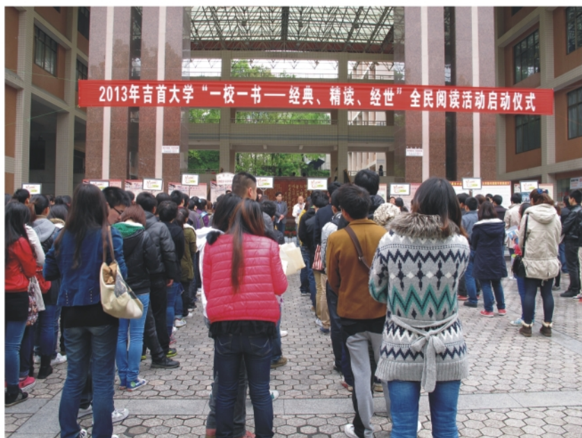
4月23日，我校举行“一校一书——经典、精读、经世”全民阅读活动启动仪式。