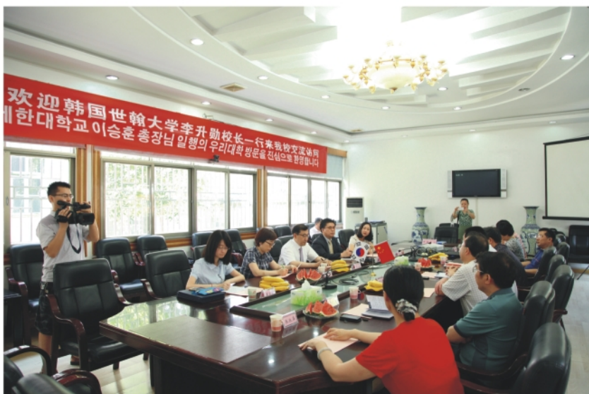
7月2日，韩国世翰大学李昇勋校长一行来校交流访问。